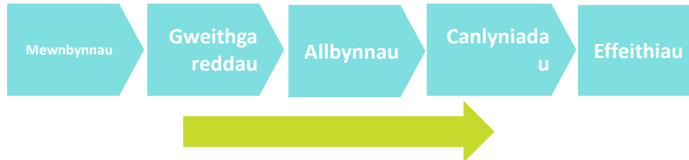
Ffigur 2: Elfennau Model Rhesymeg

Yn yr un modd, efallai eich bod eisoes yn gyfarwydd â'r adnodd 'Model Rhesymeg'. Dangosir elfennau model rhesymeg isod. Yn fras, mae Model Rhesymeg yn galluogi i chi olrhain y cyswllt rhwng beth rydych yn ei gyfrannu at eich ymgyrch (amser, adnoddau, £), y gweithgareddau rydych yn eu cynnal (e.e. digwyddiad, ymgyrch hyrwyddo, diwrnod gweithgarwch) a'r canlyniadau a'r effeithiau o ganlyniad (h.y. newid sydd wedi digwydd o ganlyniad i'ch gweithgaredd). Felly mae'n eich helpu chi i ddangos a mesur effaith polisi.