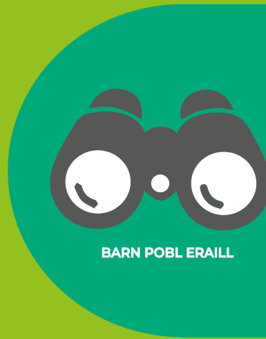
BARN POBL ERAILL

Cytunwyd ar eiriad canlyniadau Our Bright Future yn 2017, ar ôl ei fireinio ar ôl i'r portffolio gael ei ddewis er mwyn adlewyrchu'r ystod o weithgarwch yn well. Mae pob un o'r pedwar canlyniad https://www.ourbrightfuture.co.uk/about/our-vision/ yn amlweddog ac ar y cyd maent yn cynrychioli llawer o nodau rhyng-gysylltiedig. Roedd rhai o'r unigolion a gymerodd ran yn ei chael yn anodd mynegi'n gryno beth oedd pwrpas Our Bright Future. Fodd bynnag, y nod deulol o gefnogi pobl ifanc a'r amgylchedd i ffynnu oedd sylfaen gweledigaeth Our Bright Future. Gallai datganiad cenhadaeth clir, byrrach fod wedi bod yn fuddiol.